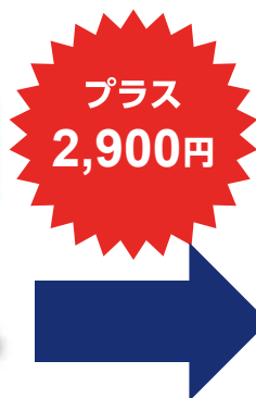
NBox G Honda SENSING